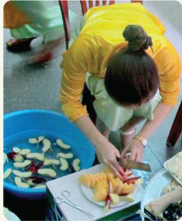
Những chiến binh thám lậg của nhà CEN