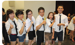
Những "Dancer" bắt đặc đi ☺