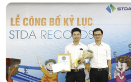
Team Durgroup đạt kỷ lục số lượng giao dịch nhiều nhất tháng 8.2014

Trong thời gian sắp tới, mục tiêu và phương hướng của team Durgroup sẽ tiếp tục xây dựng và duy trì văn hóa đoàn kết - “sức mạnh lớn nhất của team” để chinh phục không chỉ HP Landmark Tower, CT Number One, mà còn rất nhiều dự án khác với số lượng giao dịch đột phá.