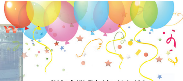
Chị DuyênNH: Phó phòng hành chính

Gắn bó với Cen cũng khá lâu, nhưng với mình lần sinh nhật này của Cen cũng thật mới và thú vị. Bước vào tuổi 12, chúc Cen sẽ phát triển hơn nữa. Cen sẽ không chỉ mở rộng trên tất cả các thành phố lớn của cả nước, mà còn lan rộng trên thế giới.