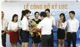
Nụ cười chiến thắng sau những ngày gian khổ