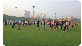
1 2 3 tập thể dục buổi sáng :)