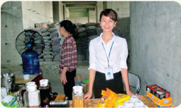
Những chiến binh thám lậg của nhà CEN