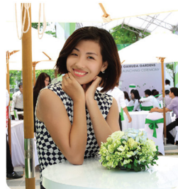
Yennth - TM "Chức công ty trở thành tập đoàn BDS số 1 Việt Nam"

Gắn bó với Cen cũng khá lâu, nhưng với mình lần sinh nhật này của Cen cũng thật mới và thú vị. Bước vào tuổi 12, chúc Cen sẽ phát triển hơn nữa. Cen sẽ không chỉ mở rộng trên tất cả các thành phố lớn của cả nước, mà còn lan rộng trên thế giới.