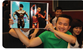
"Thần tượng nhà CEN" trong mắt anh ấy