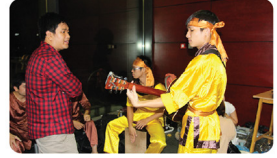
Thí sinh CEN's Gottaent luyện tập hàng say trước giờ "G"