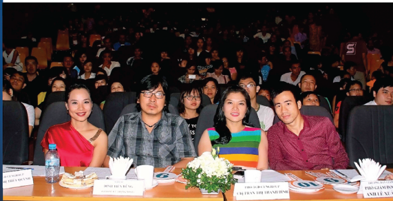
Bộ tư quyền lực của Cen's Got Talent 2014

Những hiệu ứng tích cực mà chương trình mang lại cho toàn thể anh chị em Cen đã khẳng định năng lực chuyên nghiệp của đội ngũ BTC Cen's Got Talent. Toàn thể anh chị em Cen đều mong sẽ ngày càng có nhiều chương trình hơn để mọi người có thể tham gia, khẳng định bản thân, giải trí sau những giờ làm việc căng thẳng./