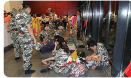
"Những chủ bộ đội nhà CEN" tại CEN's Gottaent 2014