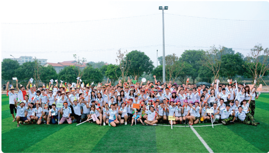
Hội thao chào mừng Cen Group 11 tuổi năm 2013

Cen Group đã trải qua 12 năm hình thành và phát triển, sự phát triển của Cen ngày hôm nay có một phần đóng góp không nhỏ của những "chiến binh thầm lặng".