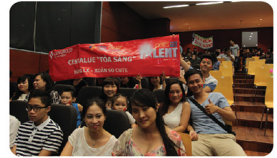
Những cô động viên...