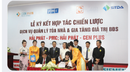
Lễ ký kết hợp tác giữa Hải Phát và CenPlus sự kiện đánh dấu sự bước phát triển của CenPlus