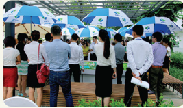
Rừng ở STDA :)