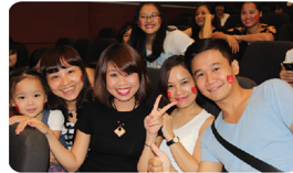
Chúng tôi yêu Việt Nam - Chúng tôi yêu Cen Group