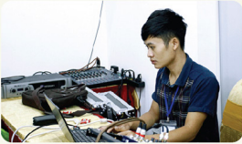
Những chiến binh thám lậg của nhà CEN